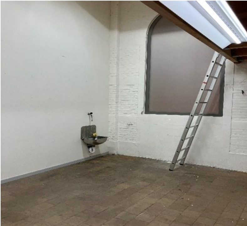
Bijlage 3 foto's atelier 2.08