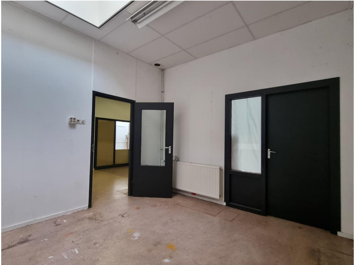
Atelier 0.16, doorkijk naar 0.13