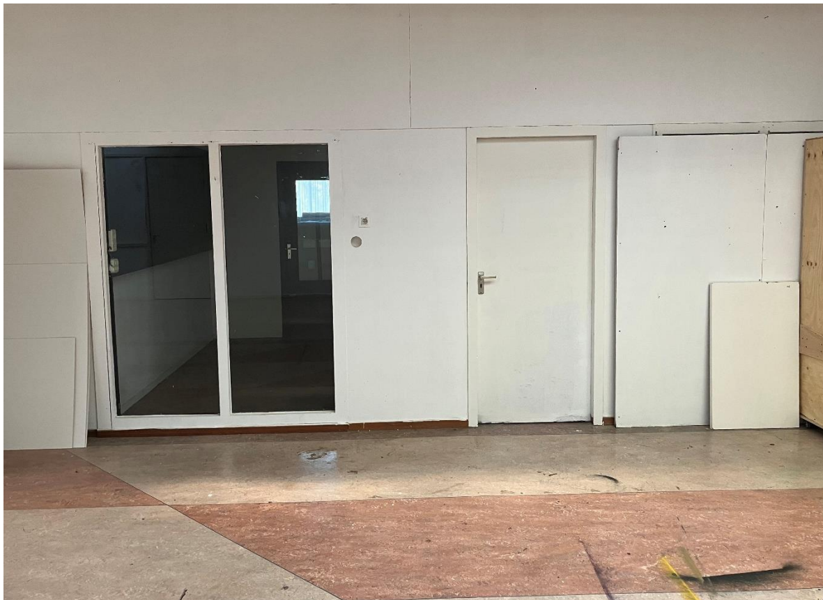
Buitenzijde atelier 0.13