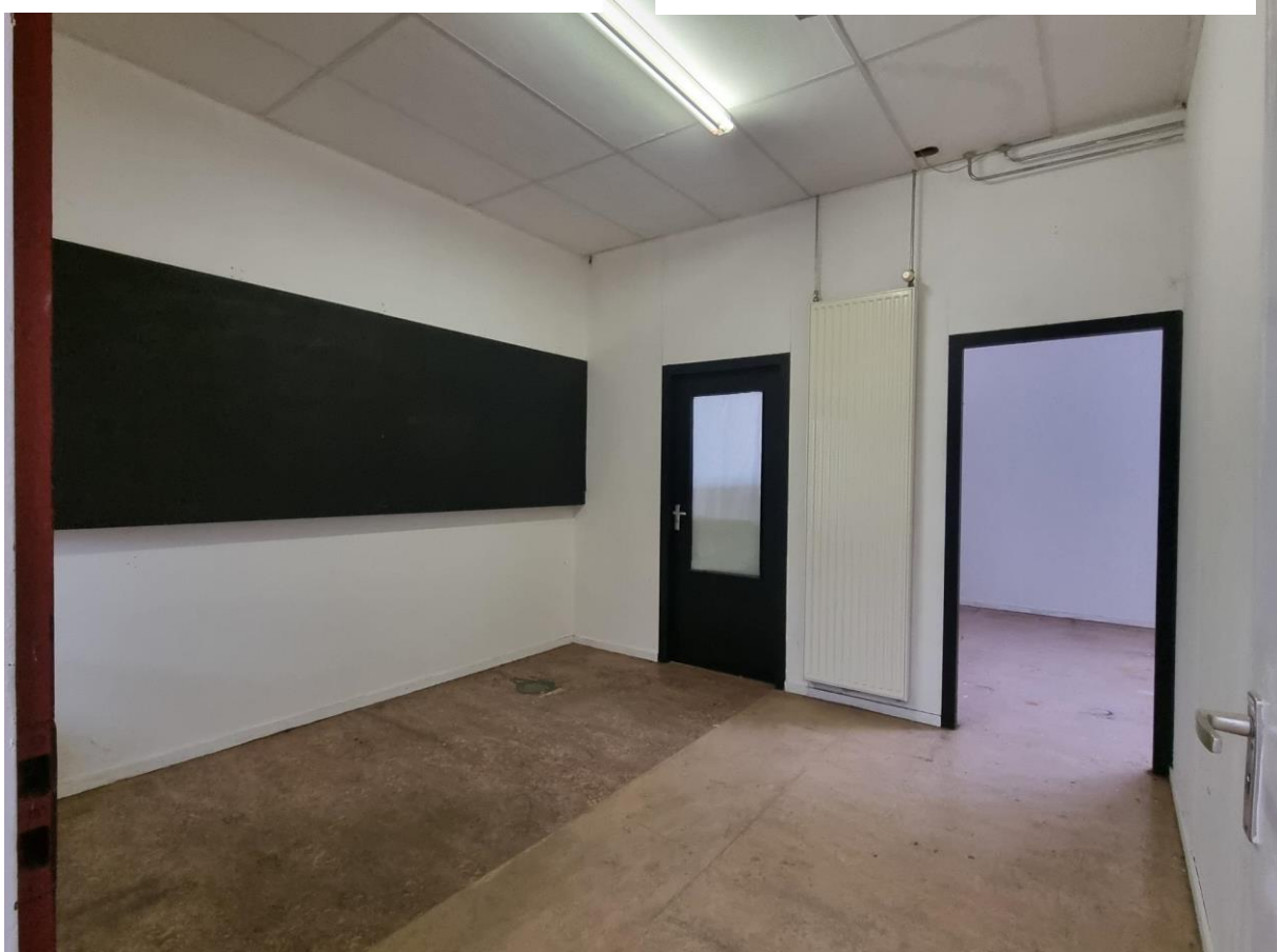
Atelier 0.13 met zicht richting atelier 0.16