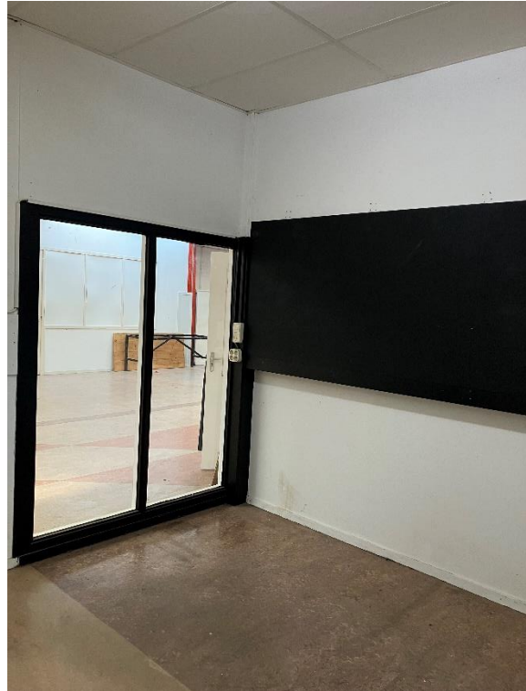
Raam in atelier 0.13