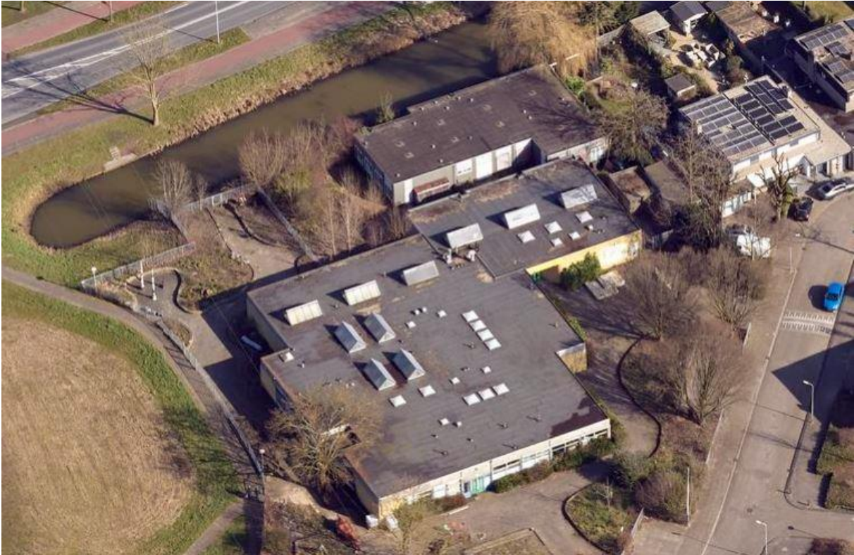
Noorderlicht hoofdgebouw en bijgebouw