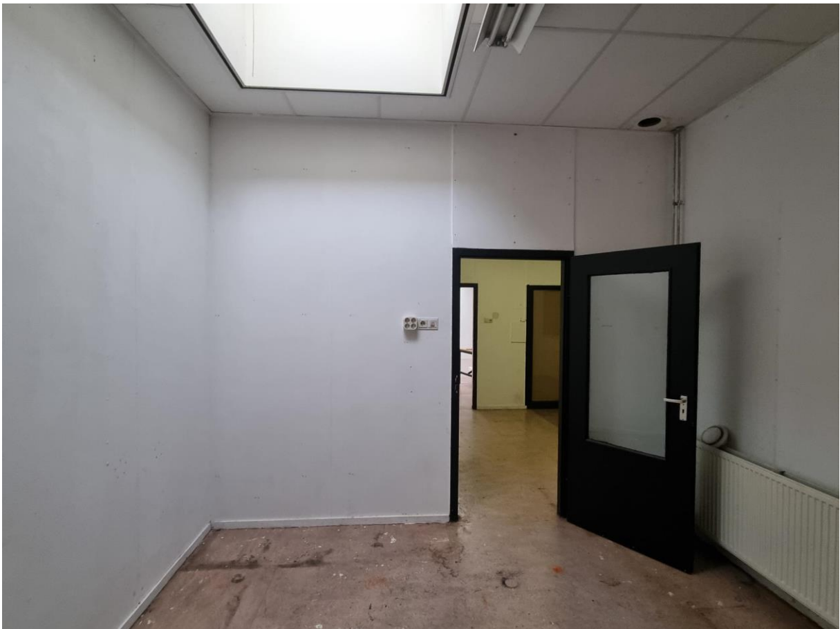
Atelier 0.16 met daklicht en doorkijk naar 0.13