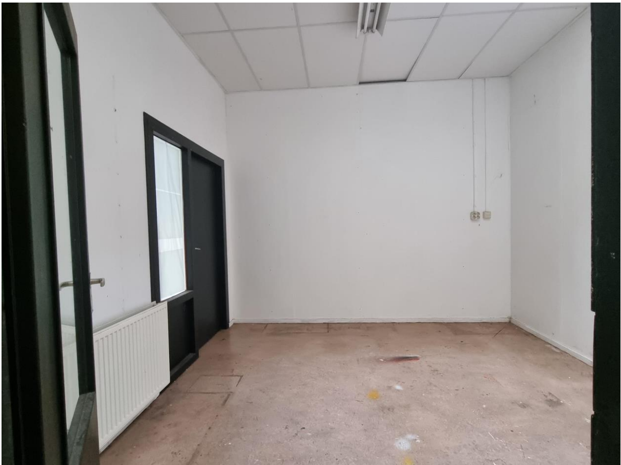
Atelier 0.16, gezien vanuit 0.13