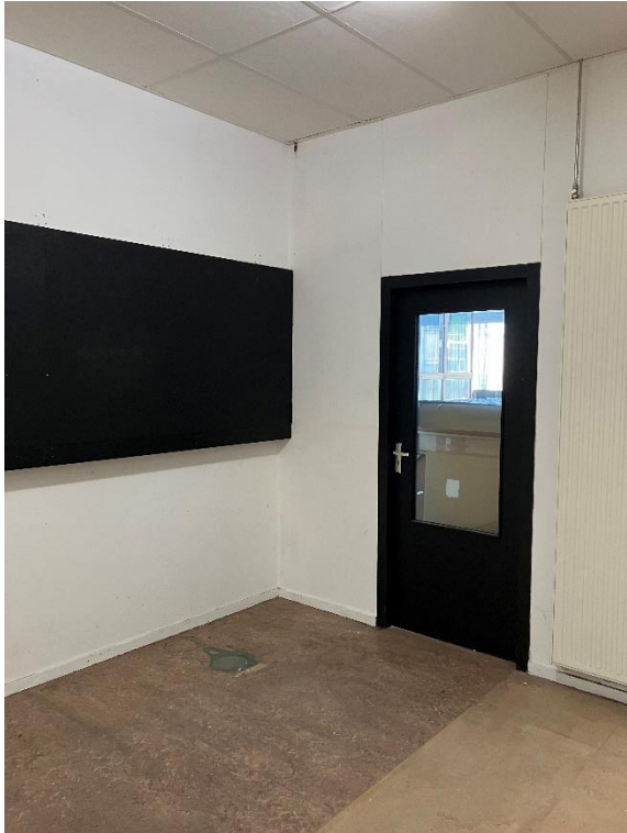
Deur in atelier 0.13 (geen doorgang)