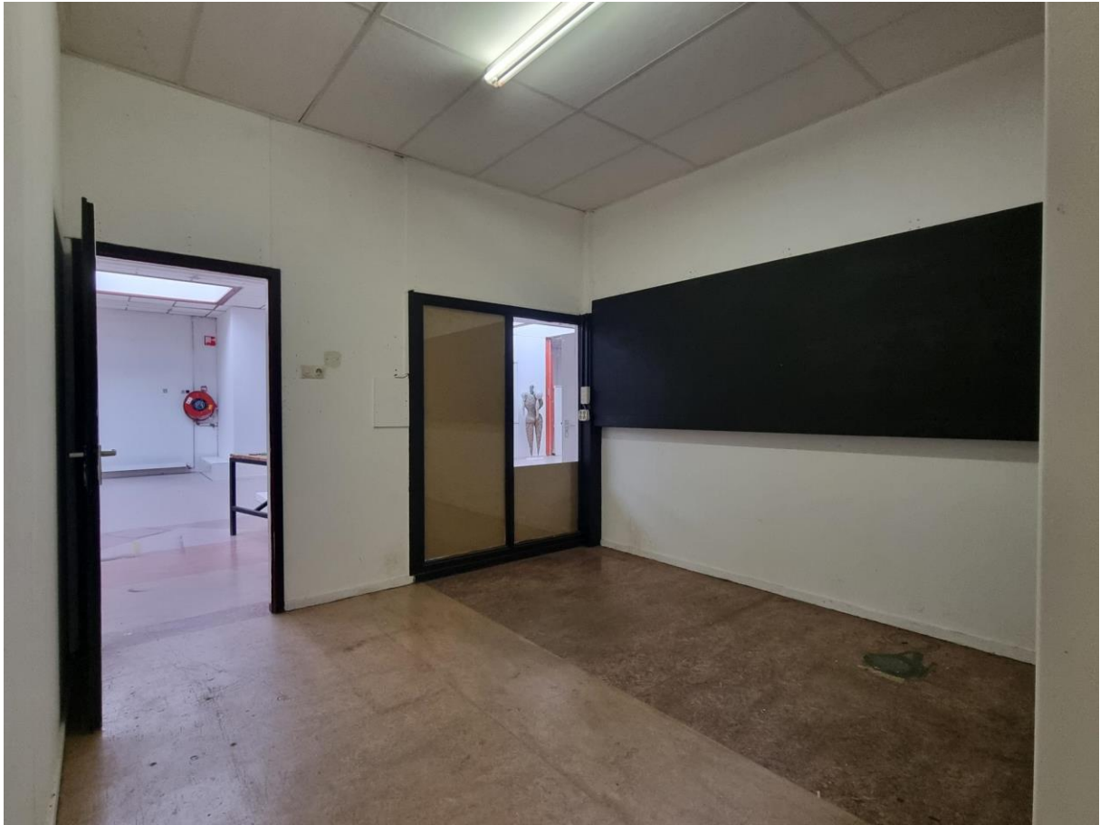
Atelier 0.13 met zicht richting de hal