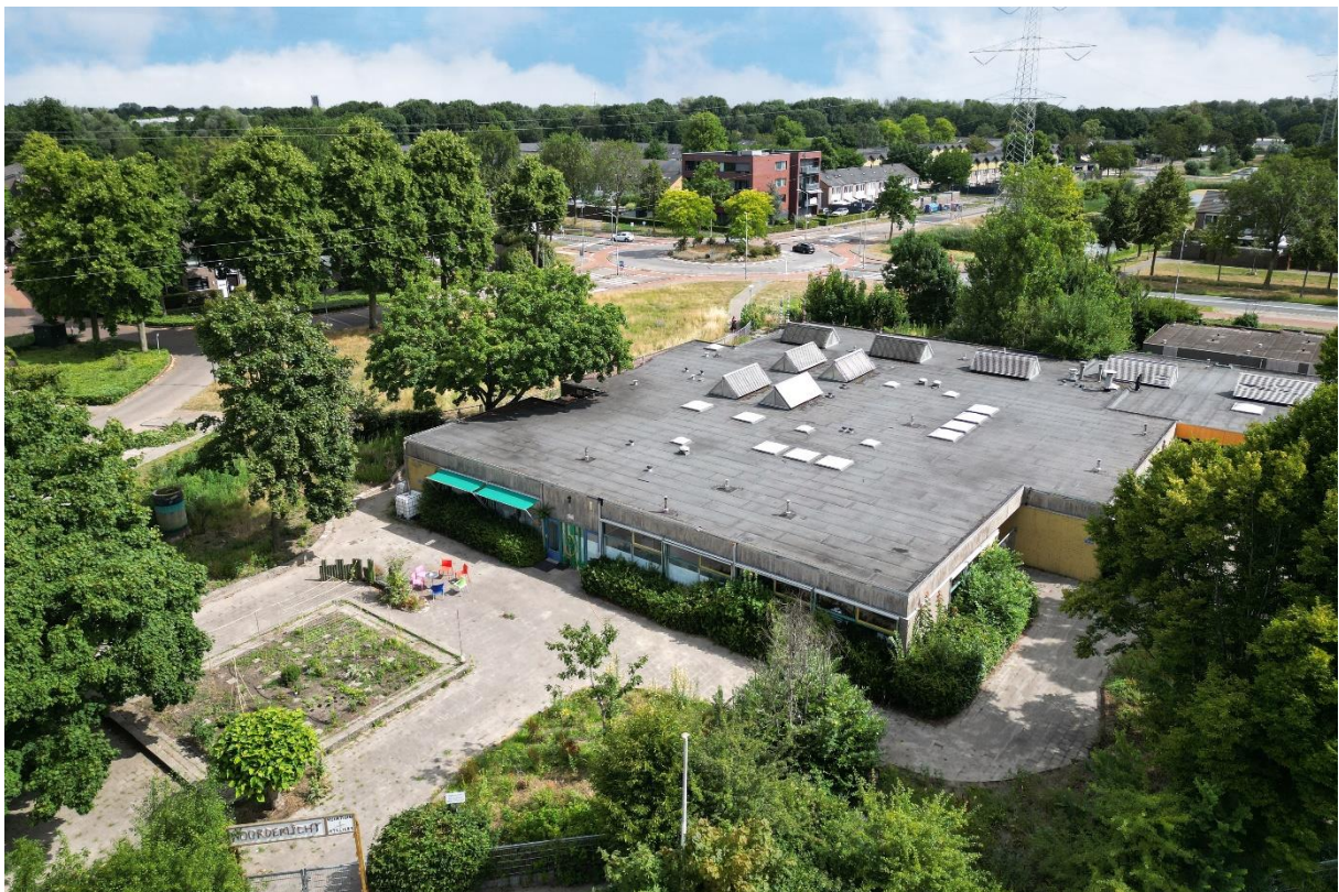
Noorderlicht hoofd- en bijgebouw