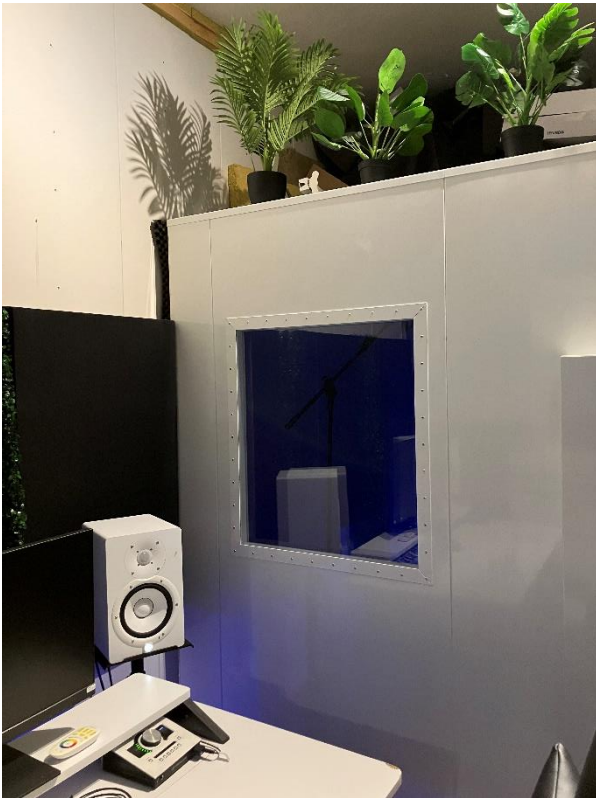
Zicht op geluidsdichte ruimte