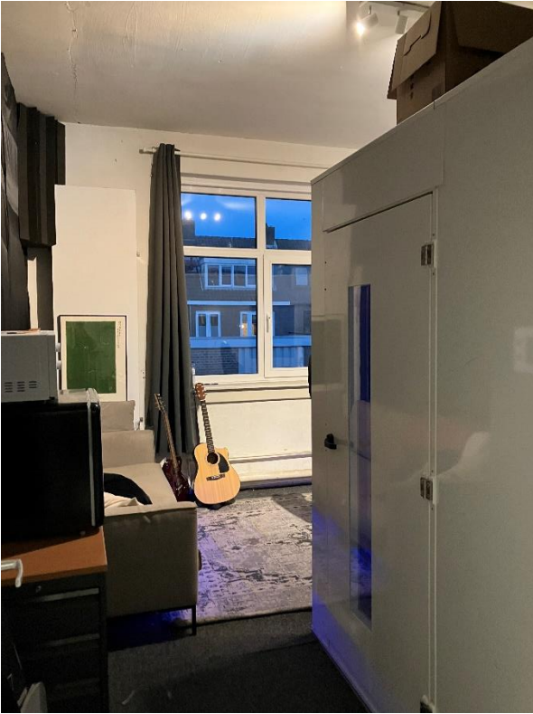
Rechts de deur naar een geluidsdichte opname ruimte