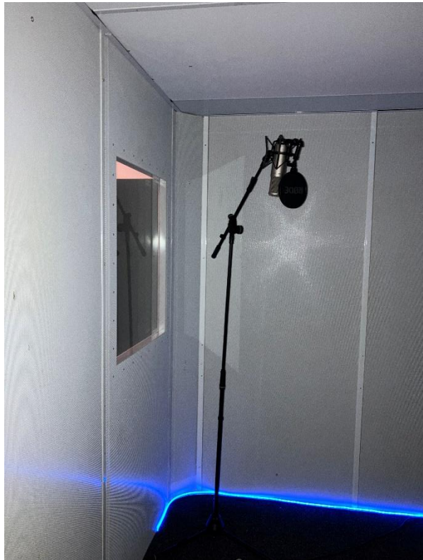
Geluidsdichte opname ruimte